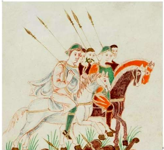
Vyobrazení franské vojenské jízdy. Ilustrace z Trevírského rukopisu z 8.-9. stol.