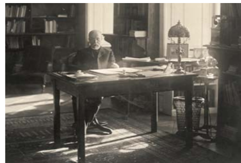
▲ Tomáš Garrigue Masaryk ve své pracovně na Pražském hradě, 1920.

Pracovní list pro žáky 8. a 9. tříd ZŠ a SŠ k expozici Tomáš Garrigue Masaryk a rodný kraj