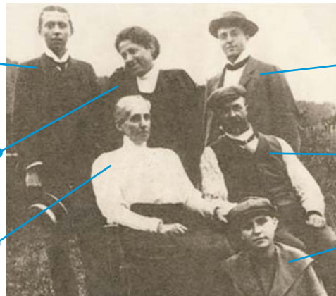
▲ Masarykova rodina v Žabárně u Valašského Meziříčí, 1905.